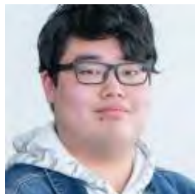
文教大学 りく先輩