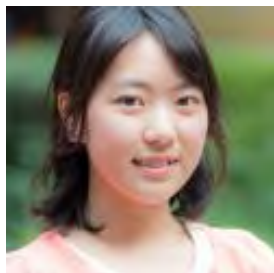
お茶の水女子大学 まあのん先輩