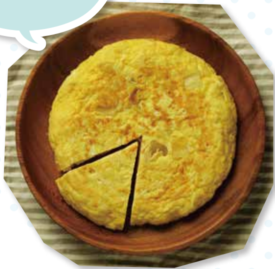
スパニッシュ オムレツ