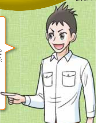
「進研ゼミ」会員アンケートより

成人年齢の引き下げは不安に思っている人のほうが多かったよ。若いうちから責任や負担が増えることに心配があるようだね。引き下げは良いと思う人は、早くから大人の自覚を持つことが社会にとって良い影響があると考えているね。きみの成人年齢は18歳になるけれど、お酒やたばこが許される年齢は20歳のままだよ。今回の決定を機会に、成人として必要な責任とは何かを考えてみるのも大事なだね。