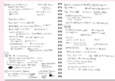
下湯湯先生のノートより

例えば、運動会のリレーでは子ども自身で走る順番を決めますが、どういう順番だと勝てるか、アイデアがなかなか出てこないチームもあります。行き詰まっているようにも見える子どもたちに、アドバイスするか、それとも見守るか迷っていることをカリキュラム会議で話したところ、「順番の変え方を教えてあげることで、子どもたちが自分で工夫できるようになる