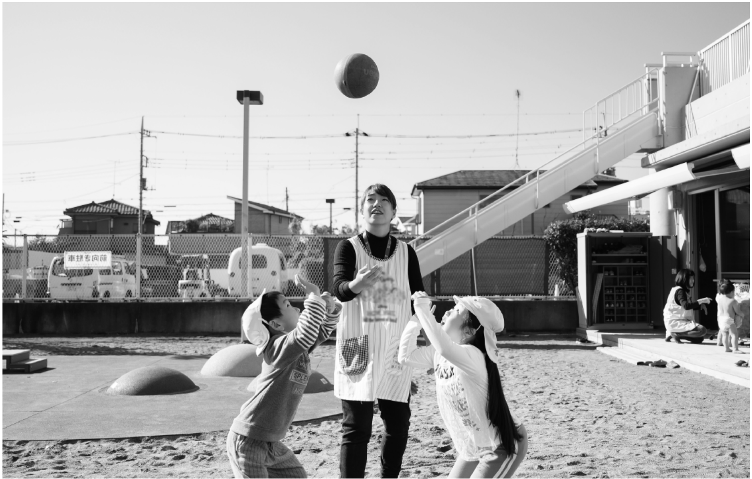
今号の写真 [表紙 / 裏表紙 / 上] ©太陽の子保育園 (東京都・私営)