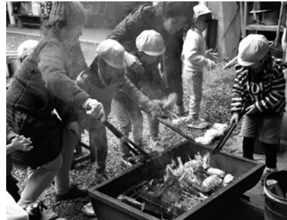
写真1 ●「もりへいこう」では、毎月子ども自身が考えた季節感あふれる活動を展開しています。保護者の参加を積極的に受け入れているため、子どもも自然に多くの保護者とかかわっています。