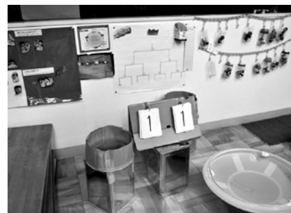
写真●年長組のコマ遊びのコーナー。保護者提供のシーリングライトのカバーが「バトル場」となっています。保育者がさまざまな掲示により遊びを「可視化」し、子どもの興味・関心を広げています。

子どもが遊び込める環境をつくる上では、保護者が重要な役割を果たしています。例えば、年長組がペットボトルのふたを使ったコマ遊びに