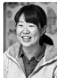
東一の江幼稚園 年長組担任