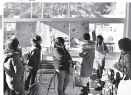
写真4 ● お迎えの時間、その日の遊びの印象的な場面を伝えます。この日は、5歳児が数日間にわたって、サンタクロースについて話し合い、手紙を書くまでの様子を、模造紙に写真と文章にまとめて説明しました。

「3年間を通して、自ら物事に取り組んで最後まで諦めずに頑張ったり、相手と話して折り合いをつけた上で、『自分はこう思う』と伝えられたりする力を育てたいと考えてい