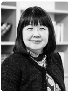
東京大学大学院 教授 秋田喜代美先生