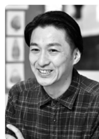
東一の江幼稚園 園長

遊びを充実させる手法の1つが、『遊びの可視化』 です。例えば、遊びに熱中する子どもの姿を写真にとったり、子どもが出し合ったアイデアを整理したりして保育室に掲示します。すると、その子自身が「もっと頑張ろう」という気持ちになったり、興味をもったほかの子どもに遊びが広がったりします。