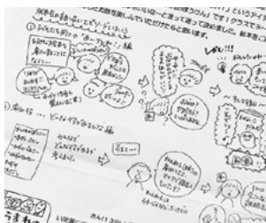
クラスだより 浅野先生による年長組のクラスだより。イラストや子どもが発した言葉で伝えています。やわらかな印象となり、保護者に気軽に読んでもらえる効果もあります。