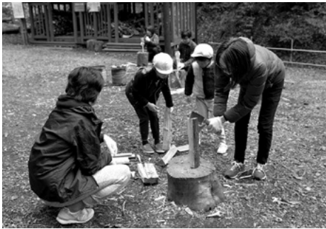
▲まきを割って火をおこして焼き芋作り。