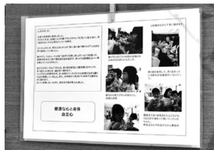
写真2 ●廊下に掲示されたポートフォリオ。タイトルをつけ始めてから、子どもの育ちが伝わりやすくなりました。多くの保護者が毎日楽しみにしています。

にはかりを渡したら重さを比べ始めた場面を紹介し、『数量への関心・感覚が育っている』といったタイトルをつけました。翌日には保育室にもはかりを置いていたのですが、このようにして数量への関心を広げようとしていることも、保護者に感じていただきたいです(鈴木先生)