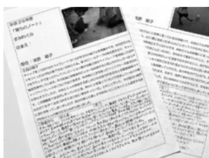
育ちのノート 一人ひとりの見えにくい育ちを伝える「育ちのノート」。保護者と対面で話す機会がない時期に隔月ペースで発行しています。