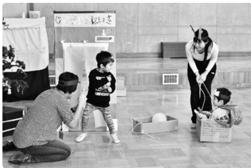
写真1 ● 2017年12月に実施された「遊ぼうDay」。保護者は自分の子どもだけでなく、ほかの年齢のクラスも回り、それぞれの遊びを楽しんでいました。