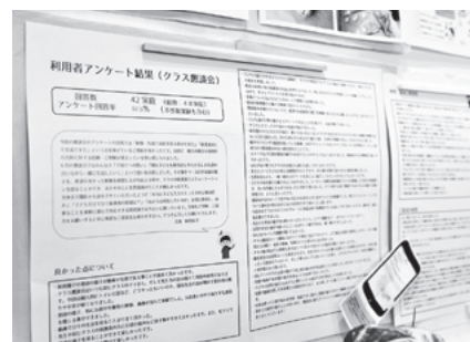
写真4 ● エントランスホールに保護者アンケートの意見と園の考えを掲示。園専用のウェブサイトでも公開しています。