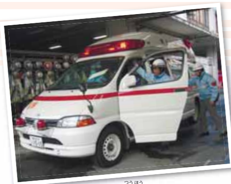
▲119番通報で出動する救急車