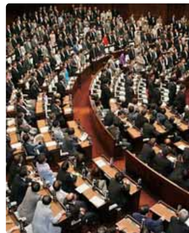
▲国会の話し合いの様子

ニュースで目にする国会や地方議会では、 国や都道府県、市区町村の決まりや活動の 内容を決めるために、さまざまな話し合い をしているよ。 そして、意見が分かれるときは、主に多数 決で結論を出しているんだ。 もし、きみのクラスで何かを決めるとき に、意見が分かれてまとまらなかつたら、ど うやって決めるのがいいかな？