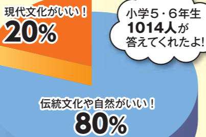
「チャレンジウェブ」アンケートより

伝統文化や自然がいいという意見の多くは、「日本ならではの文化や自然を見てほしいから」だったよ。一方、現代文化がいいという意見の多くは「マンガやアニメなど日本の現代文化のすぐれたところを知ってほしいから」だったよ。海外の人に何をPRしたいか考えることでわたしたちも日本のよさを再発見できるよ。