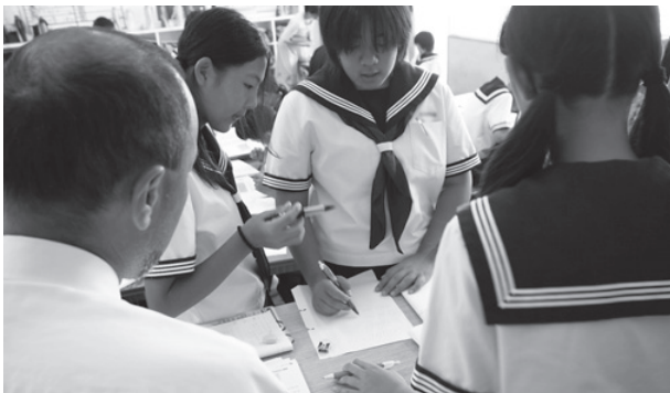
生徒同士の話し合いに教師が加わり、ヒントを出す様子。それまで数式だけで考えていた生徒たちに、図を書くことをアドバイスしている